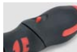
Кнопка для изменения формы рукоятки