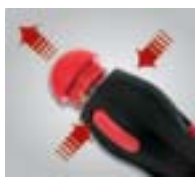
Встроенный в рукоятку магазин на 6 бит